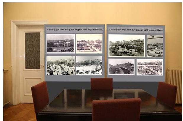
Εικόνα 15– Ενότητα Α Πιθανή θέση εκθεσιακών πάνελ στο χώρο υποδοχής.

Α' Ενότητα: Εισαγωγή. Θα διαμορφωθεί στο χώρο υποδοχής και θα είναι αφιερωμένη στις Σέρρες του Μεσοπολέμου, την εποχή που ανοικοδομήθηκε η κατοικία. Θα υπάρχουν περιμετρικά πάνελ με εποπτικό υλικό (φωτογραφίες, κ.α.) από την εποχή.