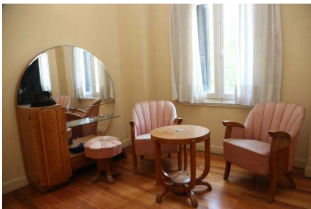
Εικόνα 11 – Το υπνοδωμάτιο.

Υπάρχουν δύο υπνοδωμάτια. Στο πρώτο, τα έπιπλα είναι και αυτά art deco από ξύλο ελιάς όπου η γεωμετρία συνδυάζεται με την παράδοση της γαλλικής αισθητικής. Οι δύο πολυθρόνες, το скаμπίο και το ανάκλιτρο που υπάρχει στο χώρο, είναι επενδυμένα με ροζ πολυτελή μεταξωτή στόφα.