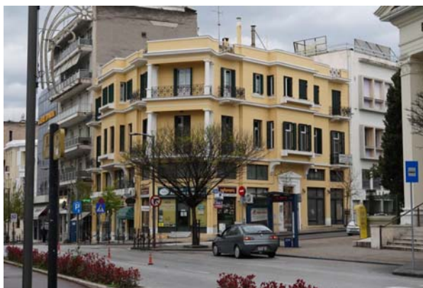
Εικόνα 5 – Η Οικία Παπαβασιλείου.