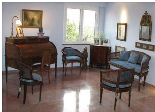
Εικόνα 3 – Το σαλόνι και το γραφείο της Λητώς Κατακουζηνού.

Κατακουζηνού ανήκαν στην πνευματική ελίτ της εποχής τους, τη λεγόμενη γενιά του '30, και λειτουργούσαν ως πρεσβευτές του σύγχρονου ελληνικού πολιτισμού στο εξωτερικό και ταυτόχρονα ως εισηγητές των διεθνών τάσεων στην ελληνική πραγματικότητα. Το διαμέρισμά τους ήταν ένα από τα σημαντικότερα φιλολογικά σαλόνια της γενιάς του '30. Ποητές, συγγραφείς, καλλιτέχνες και επιστήμονες που σημάδεψαν τη σύγχρονη Ελλάδα αλλά και πολλοί επιφανείς Ευρωπαίοι και Αμερικανοί ήταν φίλοι τους και τους επισκέπτονταν συχνά για να απολαύσουν την παρέα αλλά και την ατμόσφαιρα και τη θέα του σπιτιού. Στο στήσιμο του σπιτιού του το ζευγάρι προσπάθησε να ενσωματώσει όλα όσα αγαπούσε, όλα όσα αποτελούσαν πηγές έμπνευσης στην καθημερινότητά του.