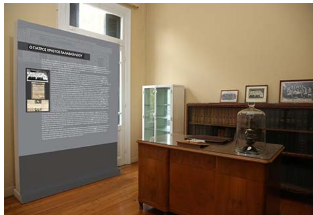
Εικόνα 18– Ενότητα Γ Πιθανή θέση εκθεσιακού πάνελ στο γραφείο με θέμα τον γιατρό Χ. Παπαβασιλείου.

χρησιμοποιηθούν σε όλες τις ενότητες θόδνες αφής όπου ο επισκέπτης θα μπορεί να βρει οπτικά και ηχητικά ντοκουμέντα της εποχής.