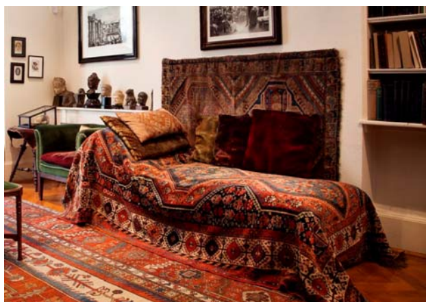
Εικόνα 1 – Ο διάσημος καναπές της ψυχανάλυσης του Φρόντ

Οι Φρόντ ήταν τυχεροί που κατάφεραν να φέρουν όλα τους τα έπιπλα και οικιακά είδη στο Λονδίνο: στο μουσείο υπάρχουν εξαιρετικά μπαούλα Biedermeier, τραπέζια και ντουλάπια καθώς και μια εξαιρετική συλλογή ζωγραφισμένων αυστριακών επίπλων εξοχής του 18ου και 19ου αιώνα. Οι τοίχοι είναι γεμάτοι με ράφια, που περιέχουν τη μεγάλη βιβλιοθήκη του Φρόντ. Τα χαλιά, επίσης, συμβάλλουν στη δημιουργία μιας αλλόκομης ατμόσφαιρας στα δωμάτια, καλύπτοντας με τα εξωτικά τους μοτίβα το διάσημο καναπέ της ψυχανάλυσης του Φρόντ, το σημαντικότερο κομμάτι της συλλογής, μέρη των τοίχων και των επίπλων και τα δάπεδα.