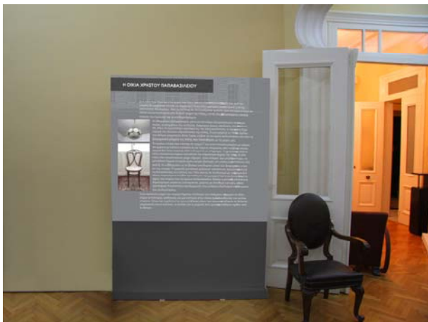
Εικόνα 17– Ενότητα Β Πιθανή θέση εκθεσιακού πάνελ στο σαλόνι με θέμα την επίπλωση και την εσωτερική διακόσμηση της κατοικίας.

Γ' Ενότητα: Η ιστορία της οικογένειας Παπαβασιλείου. Για αυτή την ενότητα επιλέγεται ο χώρος της κρεβατοκάμαρας όπου μέσα από παράθεση προσωπικών αντικειμένων, φωτογραφιών και κειμένων θα παρουσιασθεί η ιστορία των οικογενειών Παπαβασιλείου και Σταμούλη, δυο πολύ γνωστών οικογενειών των Σερρών.