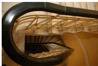
Εικόνα 8 – Η μαρμάρινη σκάλα

Η κάτοψη του σπιτιού ακολουθεί τις χαράξεις των οδών Βασιλέως Βασιλείου και Γρηγορίου Λαμπράκη. Στην είσοδο της κατοικίας κυριαρχεί η μαρμάρινη σκάλα με το κλασικίζον σιδερένιο κιγκλιδώμα με ξύλινη κουπαστή, οι γύψινες ζώνες με γεωμετρικά επίσης κλασικίζοντα μοτίβα στις οροφές και τα προσεγμένα φωτιστικά.