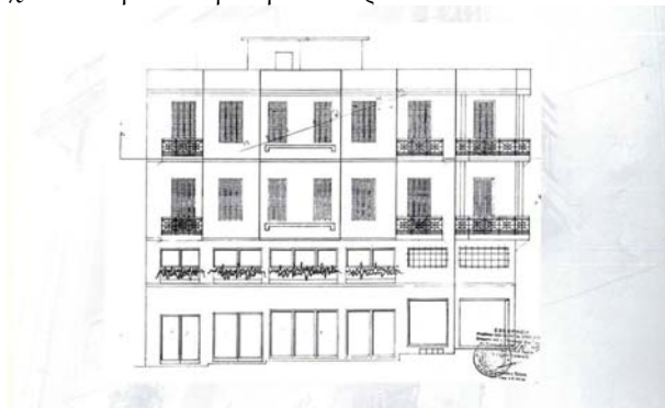
Εικόνα 6 – Η όψη από την οδό Β. Βασιλείου.