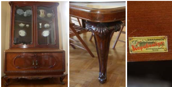
Εικόνα 10 – Η σάλα.

προέβαλαν τις δυνατότητές τους με σχέδια επίπλων μέσα από τα οποία οι πελάτες μπορούσαν να διαλέξουν τον τύπο και το στυλ που επιθυμούσαν. Τα σχέδια αυτά ήταν είτε αντιγραφές από σχέδια ξένων καταλόγων, είτε δημιουργίες Ελλήνων επιπλοποιών. Ο Καραβοκύρης, ο οποίος κατασκεύαζε αποκλειστικά ποιοτικά έπιπλα σε δικά του σχέδια, πάντα υπέγραφε τις κατασκευές του.