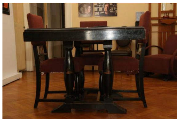
Εικόνα 9 – Ο χώρος υποδοχής.

Τα έπιπλα τα οποία είχαν επιλεγεί για να συνθέσουν το καθημερινό της οικογένειας Παπαβασιλείου είναι σε πολύ καλή κατάσταση. Στο χώρο υποδοχής υπάρχει η τραπέζα, ένα μεγάλο τραπέζι και καρέκλες, σε στυλ art deco.