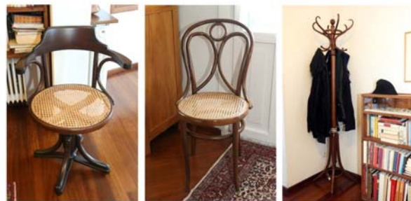
Εικόνα 13 – Έπιπλα της Εταιρείας Thonet.