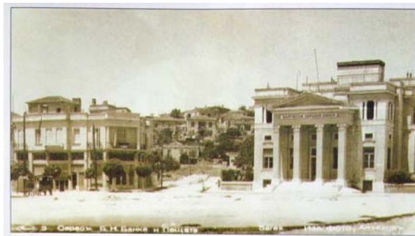
Εικόνα 4 – Η Εθνική Τράπεζα υπό βουλγαρική κατοχή. Στα αριστερά η οικία Παπαβασιλείου.

Στις 28 και 29 Ιουνίου του 1913 οι υποχωρούντες Βούλγαροι στρατιώτες έκαψαν και κατέστρεψαν το ιστορικό κέντρο της πόλης των Σερρών, το ονομαζόμενο Βαρόσι 8 . Μέχρι το 1920 η περιοχή παρέμεινε κενή κτηρίων. Τότε μοιράστηκαν τα οικόπεδα με κλήρωση στους παλιούς δικαιούχους και το 1924 άρχισε η ανοικοδόμηση της περιοχής με πρώτο κτίσμα αυτό της Εθνικής Τράπεζας Ελλάδος (στο εξής Ε.Τ.Ε.) και ακολούθησε λίγο αργότερα το 1928 και η Οικία Παπαβασιλείου.