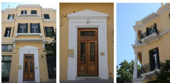
Εικόνα 7 – Η είσοδος.

Η Οικία Παπαβασιλείου βρίσκεται στην Πλατεία Ελευθερίας στο κέντρο των Σερρών, στη συμβολή των οδών Γρηγορίου Λαμπράκη 2 και Βασιλέως Βασιλείου, το αλλοτινό Βαρόσι. Η πρόσβαση στο σπίτι είναι πάρα πολύ εύκολη καθώς η περιοχή είναι πολυσύχναστη και ιδιαίτερα ελκυστική στους τουρίστες, καθώς ακριβώς απέναντι από την Οικία Παπαβασιλείου βρίσκεται το Αρχαιολογικό Μουσείο Σερρών το οποίο στεγάζεται στο Μπεζεστένι, κλειστή στεγασμένη αγορά του β' μισού του 15ου αι.